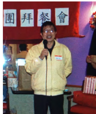
三城華人教會历任牧师