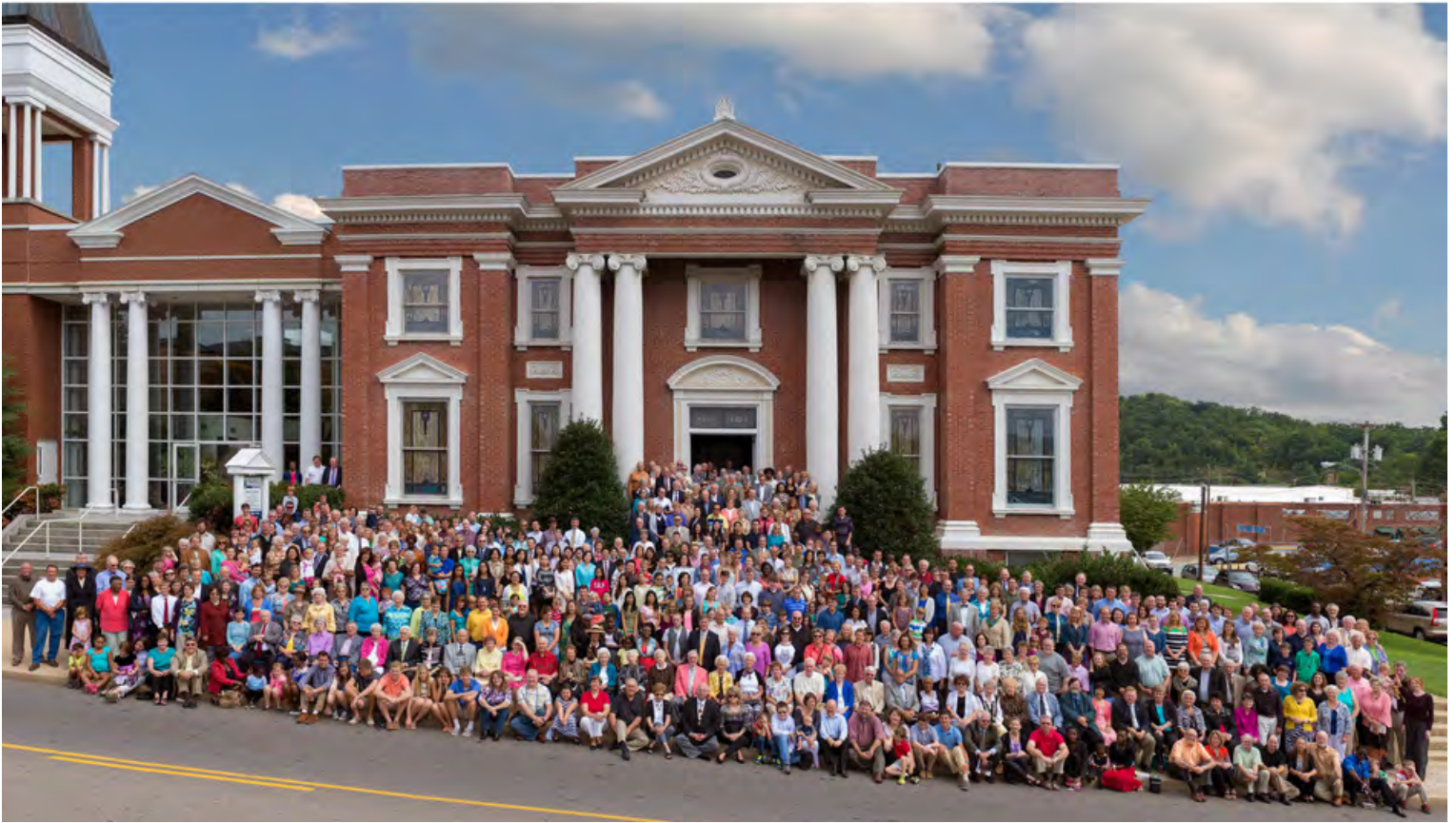
Central Baptist Church