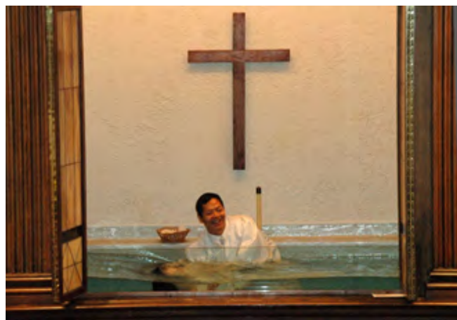
马牧师在为新得救的会友施洗

校园。2008年8月马牧师圆满完成在三城华人教会的事奉工作，返回使者协会。虽然他离开了我们，三城华人教会的弟兄姊妹仍然十分怀念他，尤其是cross cultured的弟兄姊妹们对他有着特殊的情结，因为他始终不渝地关怀爱护，解决这些家庭的需要，把神的爱送给他们。当2013年6月23日马牧师再次返回到三城华人教会做感恩见证时，许多弟兄姊妹都被他