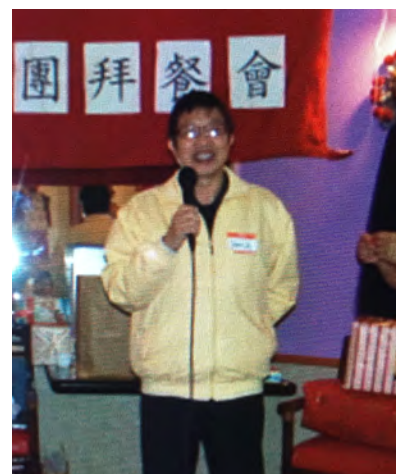
三城華人教會历任牧师