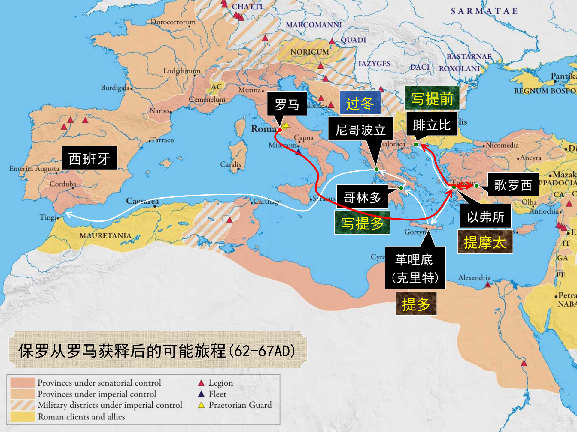
保罗从罗马获释后的可能旅程 (62-67AD)